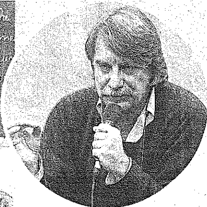
FORMAZIONE Una scuola e Paolo Crepet

NON è proprio come tornare sui banchi, ma il significato è quello. La scuola per genitori sbarca a Ravenna. Lo fa per merito di Confartigianato e della Fondazione della Cassa di Risparmio, con l'obiettivo di ribaltare il punto di osservazione dei rapporti fra genitori e figli. Che l'iniziativa sia seria, lo certifica la direzione scientifica, affidata a Paolo Crepet, psichiatra e sociologo di fama internazionale. Si chiama 'scuola' perché la funzione educativa costituisce l'obiettivo principale. In realtà si tratta di un ciclo di cinque incontri che caratterizzerà il prossimo inverno, da ottobre a febbraio, con docenti di grido. Si comincerà venerdì 29 ottobre con lo stesso Crepet che interverrà su 'I nuovi adolescenti'; giovedì 4 novembre, lo psicologo e psicoterapeuta Osvaldo Poli su 'Le differenze educative tra madre e padre'; mercoledì 15 dicembre lo psicologo, psicoterapeuta e pedagogista Mario Polito su 'Il metodo di studio per avere successo a scuola e nella vita'; venerdì 21 gennaio 2011 lo psichiatra e sessuologo Marco Rossi su 'Come migliorare l'affettività di coppia'; venerdì 25 febbraio la psicopedagogista e psicoterapeuta Maria Rita Parsi su 'Onora il figlio e la figlia'.